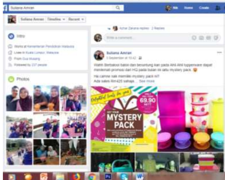
Caption : Antara promosi yang diiklankan di dalam Facebook beliau