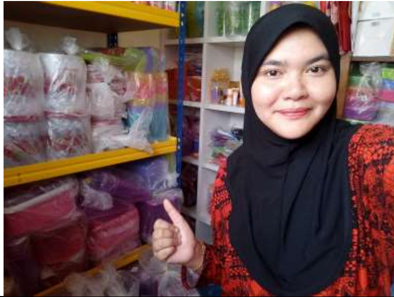
Caption : Contoh stok barangan TUPPERWARE di rumah beliau